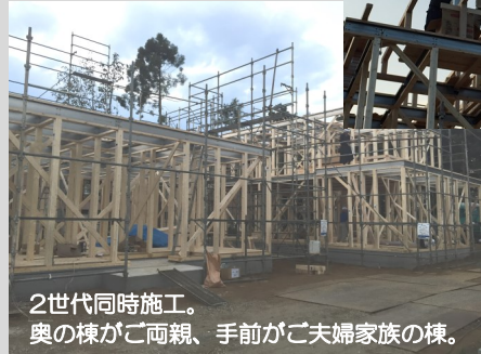
2世代同時施工。奥の棟がご両親、手前がご夫婦家族の棟。

10月吉日、柏市K様邸の上棟工事を行いました。これからいよいよ大工工事に入ります。引き続き優良工事を行い、完成時には施主さまに喜んで頂けるよう進めていきます。テクノストラクチャーの高耐震の様々な要素をご覧頂けるチャンスです。ご見学ご希望の方はお気軽にお問合せ下さい。