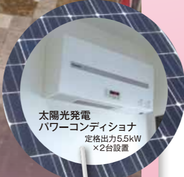
太陽光発電 パワーコンディショナ 定格出力5.5kW ×2台設置