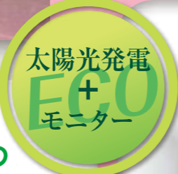
太陽光発電 ECO モニター