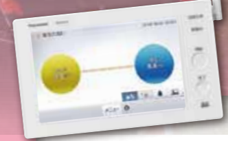
ワイヤレス エネルギーモニター(7型)